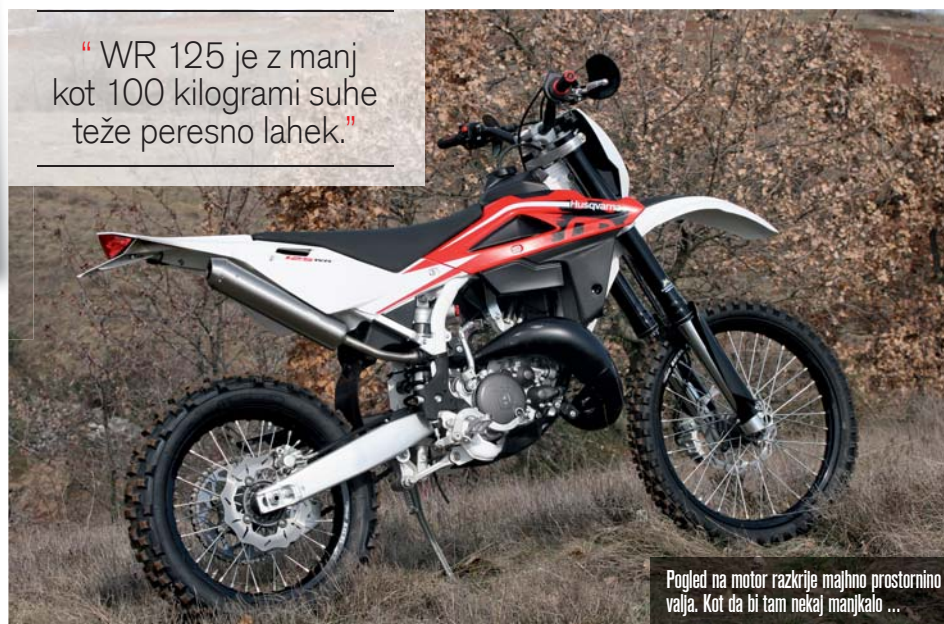
Pogled na motor razkrije majhno prostornino valja. Kot da bi tam nekaj manjkalo ...

"WR 125 je z manj kot 100 kilogrami suhe teže peresno lahek."