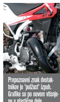
Prepoznavni znak dvotaktnikov je 'polžast' izpuh. Grafike so po novem vrstične v plastične dele.