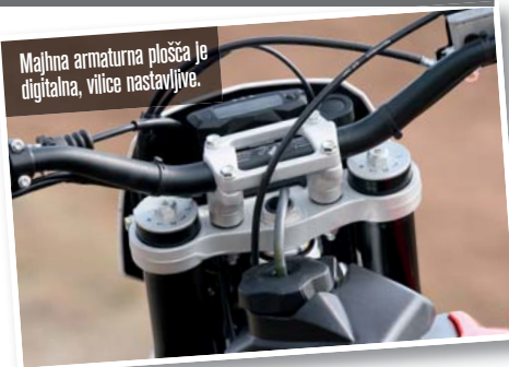
Majhna armaturna plošča je digitalna, vilice nastavljive.

"WR 125 je z manj kot 100 kilogrami suhe teže peresno lahek."