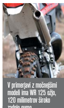
V primerjavi z močnejšimi modeli ima WR 125 ožjo, 120 milimetrov široko zadnjo gumo.