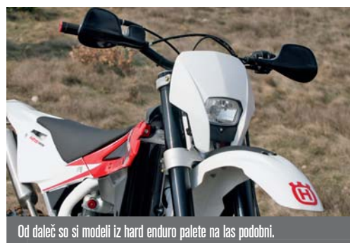
Od daleč so si modeli iz hard enduro palete na las podobni.