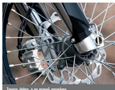
Zavore: dobre, a ne preveč agresivne.