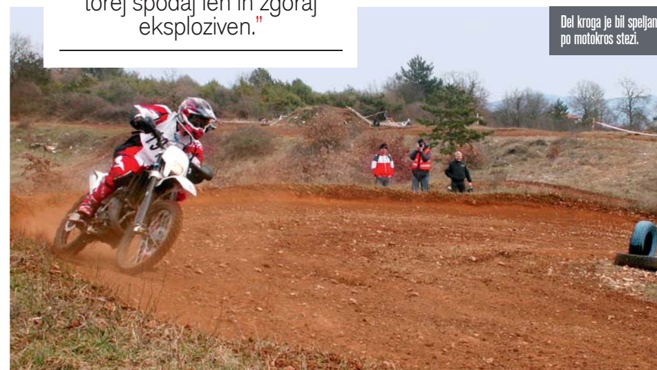
Del kroga je bil spelljan po motokros stezi.

"Motor je tipičen dvotaktnik z majhno prostornino, torej spodaj len in zgoraj eksploziven."