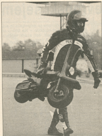
Tudi ročico ima, da ga lahko nosite tudi v roki. Toda za 50 kilogramov je potrebna mišičasta roka

Pack 2 50 je res posebež izdelovalec ga reklamira kot prepotrebni del opreme večje-